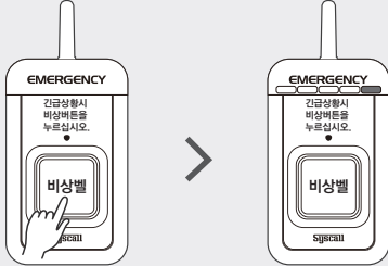
14초 동안 누름